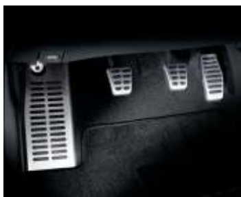
Nakładki na pedały